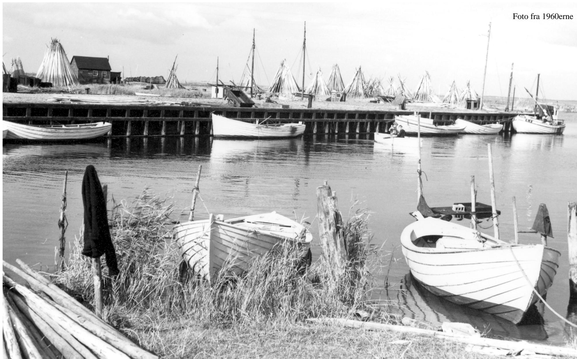
Foto fra 1960erne

I indsejlingen til havnen er der husbåde, som lejes ud til turister.