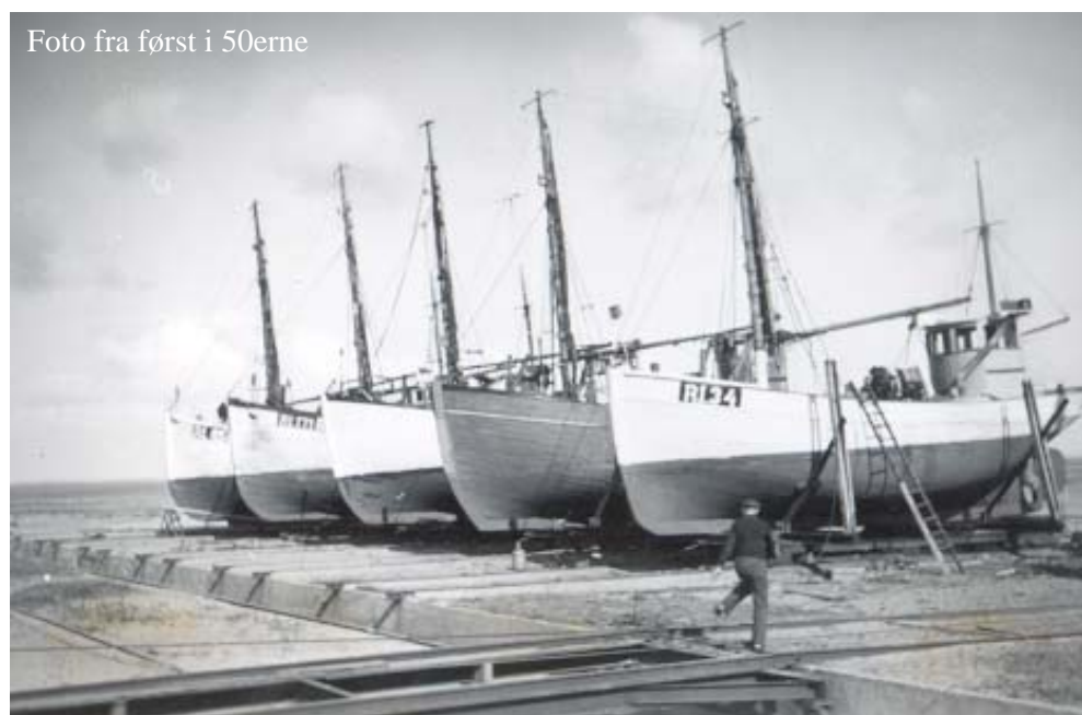
Foto fra først i 50erne